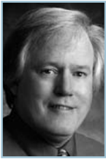
Vortrag: Die Kraft der Berührung - jüngste wissenschaftliche Erkenntnisse DR. JAMES OSCHMAN PH. D. (USA)

Auf dem Energiemedizin Symposium werden neueste wissenschaftliche Erkenntnisse zum menschlichen Energiefeld vermittelt sowie ihre Anwendung und Bedeutung für komplementäre Methoden erörtert, insbesondere diejenigen, die mit Berührung arbeiten.